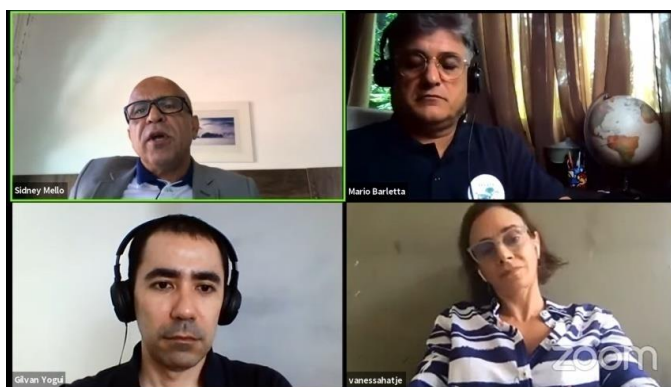
FIGURA 13: WEBINÁRIO POLUIÇÃO MARINHA.