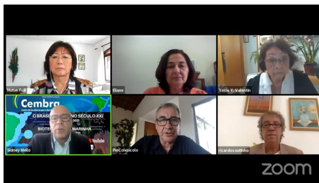
FIGURA 11: WEBINÁRIO BIOTECNOLOGIA MARINHA.