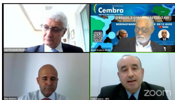
FIGURA 4: WEBINÁRIO MARINHA MERCANTE.