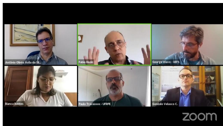
FIGURA 1: WEBINÁRIO PESCA.