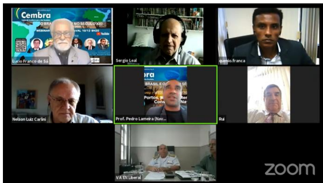
FIGURA 5: WEBINÁRIO CONSTRUÇÃO NAVAL.