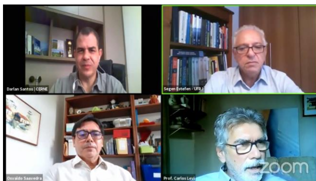
FIGURA 6: WEBINÁRIO ENERGIAS RENOVÁVEIS.