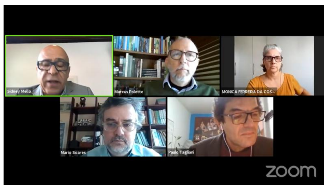
FIGURA 12: WEBINÁRIO ECOSISTEMAS COSTEIROS.