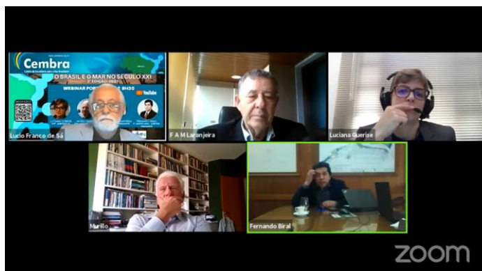
FIGURA 3:WEBINÁRIO PORTOS.