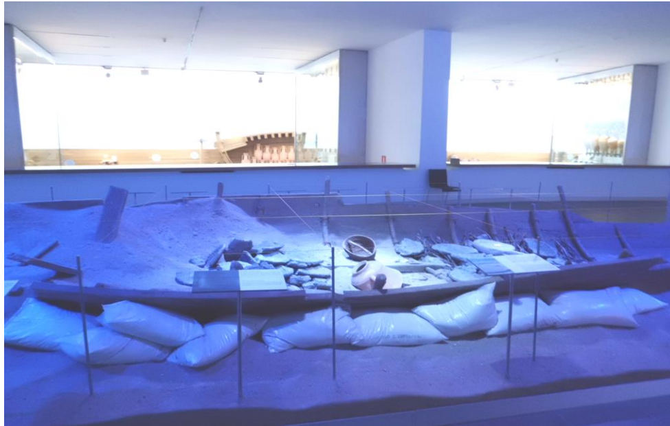
Figura 2 –Acima, pode-se observar a reprodução de um sítio de naufrágio, exposto no Museu Nacional de Arqueologia Subaquática da Espanha (Arqua). Todas as peças desse módulo são reproduções do que foi pesquisado in loco . Na maioria das vezes, salvo por questões de salvamento do sítio, é mais sensato que não se faça a retirada de artefato do meio em que já se encontra estabilizado.

A abordagem pós-processual parece ser hegemônica entre os trabalhos desenvolvidos por arqueólogos subaquáticos sul-americanos. Algumas reflexões tipicamente atinentes a essa abordagem também passaram a ser consideradas por pesquisadores processualistas. Richard Gould escreveu, por exemplo, sobre “relações contextuais” relacionadas a naufrágios e ainda “esboçou o estudo dos artefatos de um naufrágio sob o ângulo das relações de poder a bordo do navio ( Shipboard Society ), salientando alguns aspectos essenciais da estrutura sociocultural da população assim representada” (3).