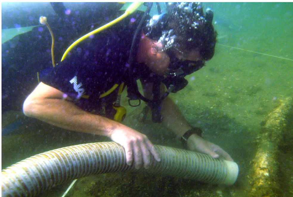
Figura 3 – Atividade de prospecção em um sítio depositário na Enseada da Praia do Farol da Ilha do Bom Abrigo - SP.